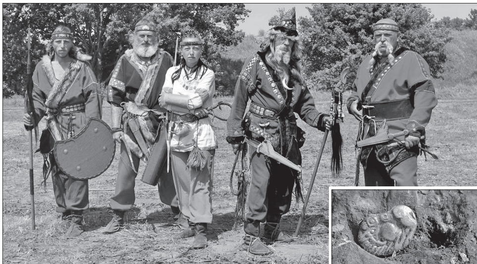
Реставратори із Запоріжжя в ролі господарів фестивалю скіфів