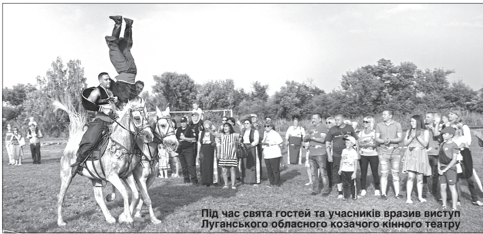
Під час свята гостей та учасників вразив виступ Луганського обласного козацького кінного театру

ся тут, на Слобожанщині. А назва Сватове символізує одвічне прагнення українців до гуртування».