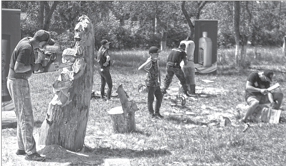
Дерев'яні скульптури прикрашатимуть територію ліцею у Великому Бичкові

Тиждень учасники працювали над витворами, демонструючи вправне володіння інструментами. Завершенням мирної битви у Великому Бичкові було оголошення пе-