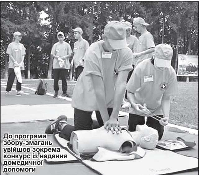
До програми збору-змагань увійшов зокрема конкурс із надання домедичної допомоги

ШКОЛА БЕЗПЕКИ. Команді з Луганщини на XVII Всеукраїнському зборі-змаганні юних рятувальників «Школа безпеки» випала змога під час показових виступів продемонструвати вміння з надання домедичної допомоги постраждалим з різними видами травм. Представляла Луганщину команда із Севе-родонецька, адже свого часу вивчала першість області. Загалом у зборах, які відбулися на базі Львівського державного університету безпеки життєдіяльності, брали участь 22 команди з різних кутків України. Кожна з них