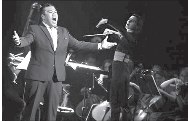
Публіку підкорює тайландський тенор Нуттапорн Тамматі

Програма фестивалю була насичена, крім концертів, різними перформансами, презентаціями, камерними вечорами, виставками. Разом з фундацією Моцартеум з австрійського міста Зальцбурга у співпраці із львівськими національними галереєю мистецтв ім. Б. Возницького та бібліотекою ім. В. Стефаніка створили експозицію до 300-річчя Леопольда Моцарта. Тут репрезентували листи Моцартові, портрети, художню графіку, музичні інструменти XIX століття, першодру-