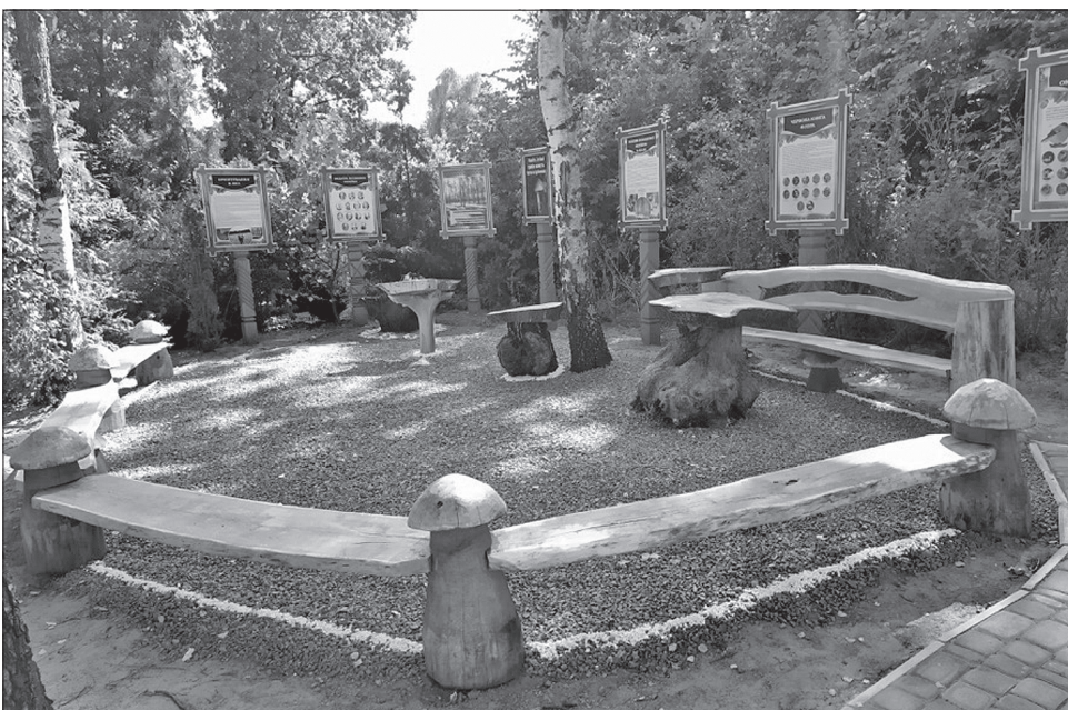
У лісовій школі є всі умови для навчання на свіжому повітрі

А що вже краса тут — не переказати! Пташині руляди, тамсичне шумовиння верховіть, зелені шати, що сягають небес.