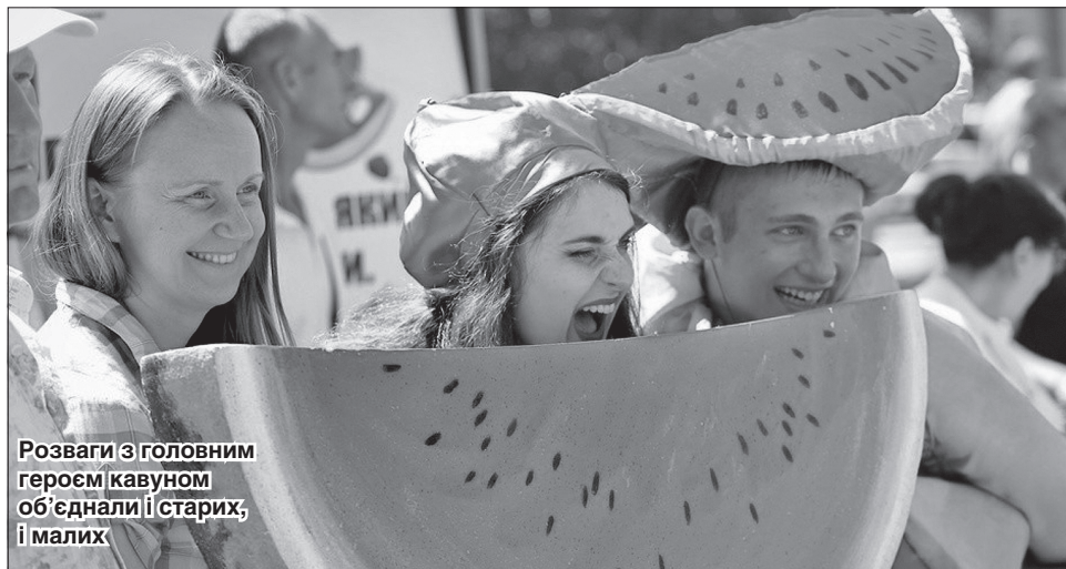
Розваги з головним героєм кавуном об'єднали і старих, і малих

Фестиваль «Український кавун — солодке диво» — своєрідний підсумок баштанного сезону, під час якого гості розважаються, а науковці та фермери з'ясовують причини вдалого чи не дуже врожаю. За висновками спеці-