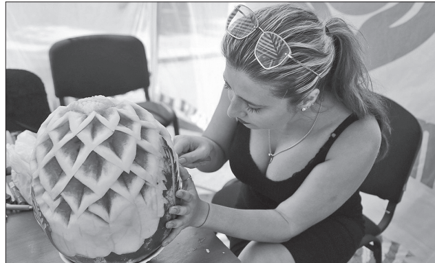
Творчий майстер-клас з вирізання по кавуну привернув увагу багатьох гостей заходу

А ще гостей заходу пригощали різноманітними холодними напоями, основою яких став кавун. До речі, приготувати їх у домашніх умовах зовсім нескладно. Так, наприклад, для кавунового фрешу необхідно змішати в блендері м'якоть ягоди, лимон, м'яту і лід, а кавунове мохіто готують з лимоном, лаймом, додаванням води, медом та м'ятаю.