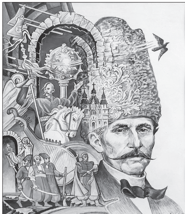
Цей графічний малюнок став основою марки, яку Укрпошта випустила до 200-річчя з дня народження Пантелеймона Куліша

Під час відкриття Укрпошта провела спецпогашення марки, виданої до 200-річчя з дня народження Пантелеймона Куліша.