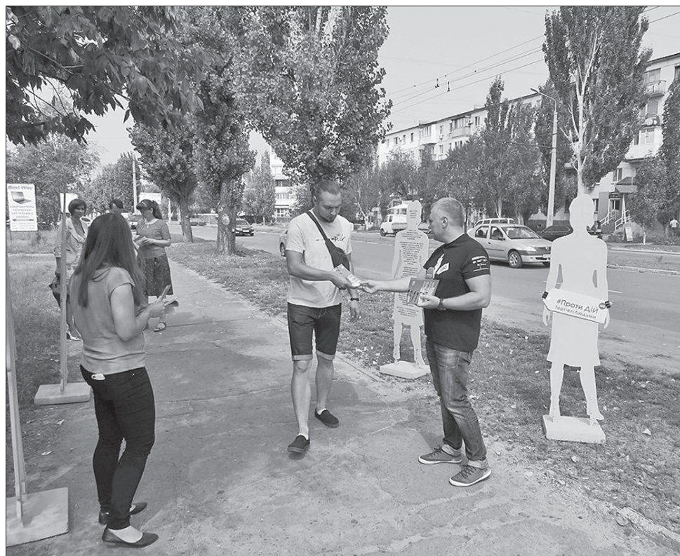
Ця артінсталяція покликана привернути увагу українців до проблем сучасного рабства