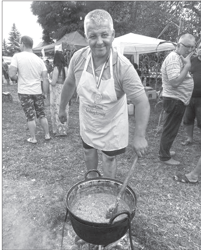
Ох і смачне ж вийшло лечо, приготоване просто неба!

День лечо у Чомі супроводжували привітання, які виголосували почесні гості, а також виступи самодіяльних і професійних артистів.