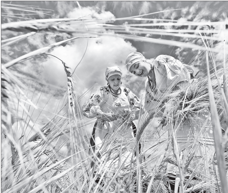
Серпень — час збирати плоди своєї праці на городі та в полі: хліб і до хліба!

Маковія, Перший Спас — велике християнське