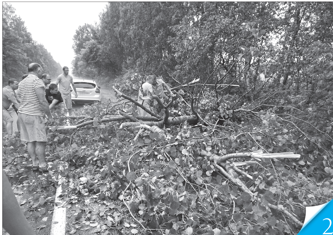
У ситуації, коли більшість дерев обабіч доріг досягли старості й через загрозу падіння підлягають вирубуванню, часу на роздуми вже немає