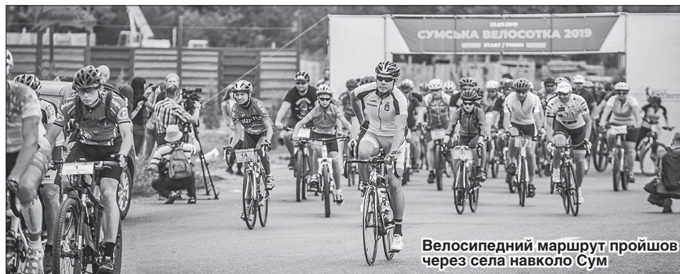
Велосипедний маршрут пройшов через села навколо Сум

особливе задоволення від такого заїзду, адже зустрілися ті, для кого велосипед — друг і помічник у повсякденні.