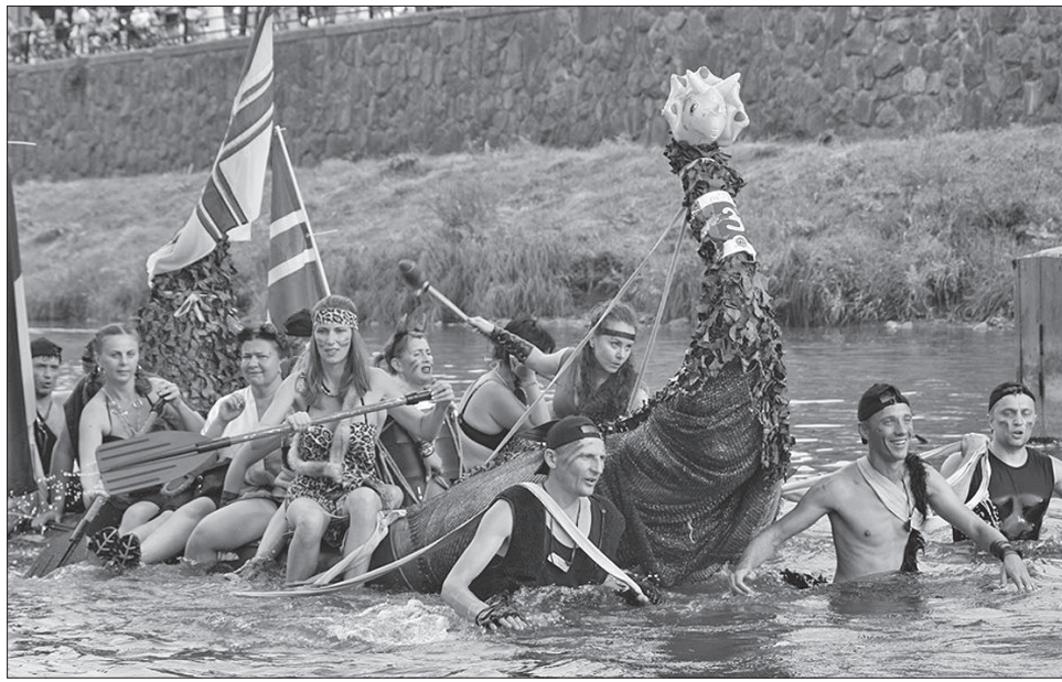
«Ужгородська регата» — свято і для гостей, і для учасників

У липні в Ужі води небагато, тож подекуди саморобні човни треба було штовхати або тягти за собою. Але учасники мужньо долали дистанцію, демон-