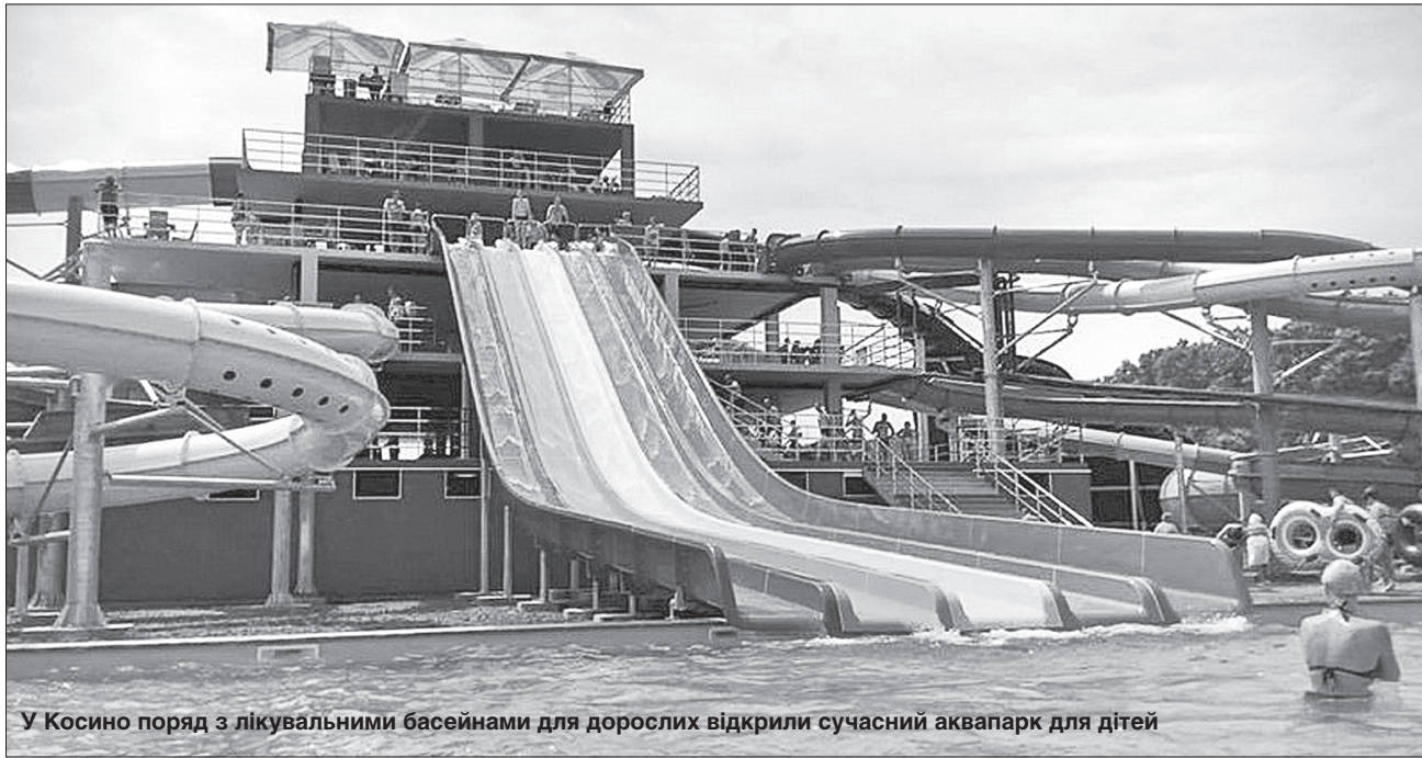
У Косино поряд з лікувальними басейнами для дорослих відкрили сучасний аквапарк для дітей