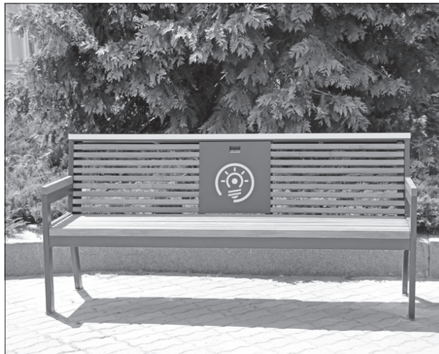
Лавочка із зарядним пристроєм уже чекає перших відпочивальників