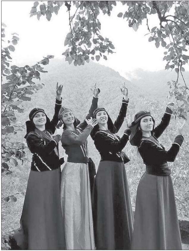
Учасники народного самодіяльного ансамблю «Нивка» підкорили серця грузинів