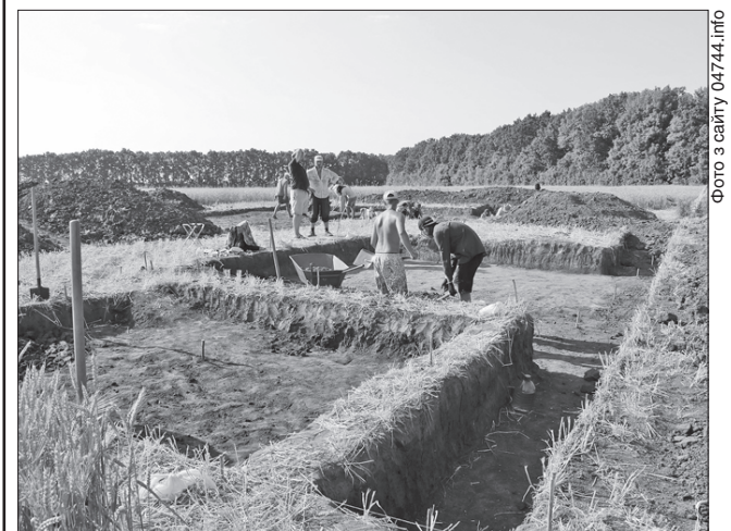
Археологічні розкопки — справа непроста, тут потрібні вміння й кмітливість

Тим часом у селі Легедзиному Тальнівського району готуються до традиційної толоки, яка почнеться 27 липня на території музею Державного історико-культурного заповідника. Цьогоріч толока стане частиною зйомок національного документально-пригодницького серіалу «Україна всесвітня» (продюсер і режисер — Сергій Проскурня).