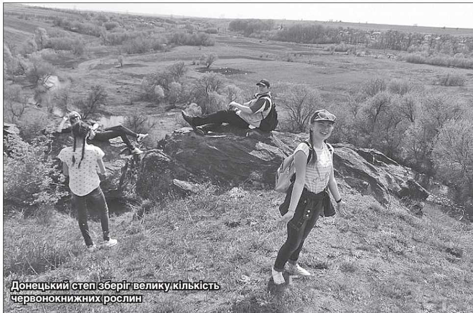
Донецький степ зберіг велику кількість червонокнижних рослин

Як уточнили в Донецькій обласній державній адміністрації, кожен заказник має площу від 46 до 65 гектарів, а всі разом вони становлять 215 гектарів. Під охорону, а тут заборонено вести сільськогосподарське виробництво чи будівництво та випасати худобу, взяли природні території первісного незайманого степу, де збереглися рослини, занесені до Червоної книги. У цій місцевості фахівці виявили чимало червонокнижних видів комах та інших степових представників фауни.