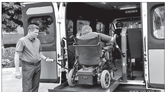
Люди з інвалідністю тепер можуть відвідати лікаря чи родичів

Програма стимулювання територіальних громад до створення служб перевезень людей з інвалідністю (соціальне таксі) забезпечує можливість доступу до інфраструктури за допомогою спеціалізованого транспорту. Вона вкрай важлива задля усунення бар'єрів у життєдіяльності людей з обмеженими фізичними можливостями, у реалізації їхніх прав і транспортної доступності, особливо тих, хто пересувається на візках. Тульчинська громада першою на Вінниччині отримала такий автомобіль.