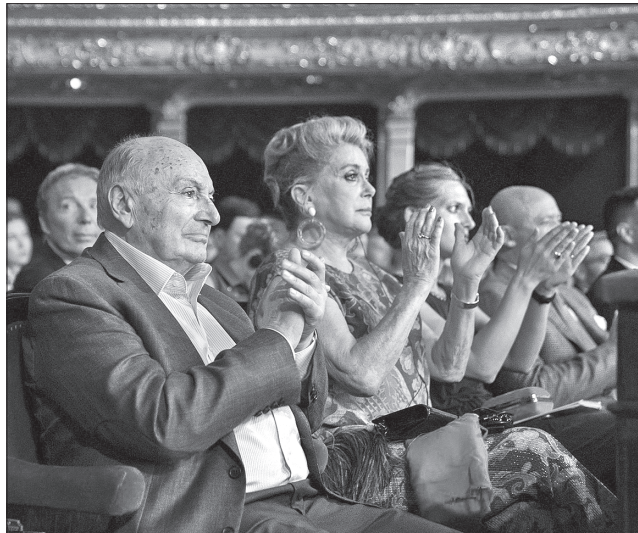
Володарі «Дюків» за внесок у розвиток кінематографії Михайло Жванецький і Катрін Деньов

ти впевнені, що досягнемо успіху, тому нам має пододатися шлях, яким ідемо».