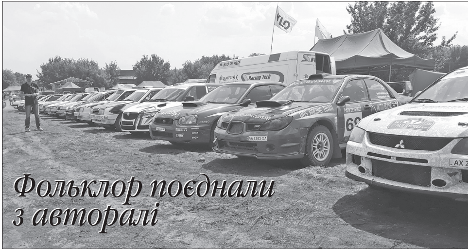
Фольклор поєднали з авторалі

Учасників свята вітали колективи художньої самодіяльності, громада пригостила автентичними стравами місцевої кухні. Відбулось урочисте відкриття «Кубку Лиманів». Спортивні автомобілі із професійними пілотами і штурманами проїхали площею села під аплодисменти вболівальників.