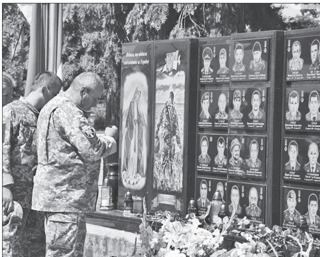
Своєрідний пантеон на честь військових — гранітна стела

ПАМ'ЯТЬ. В Ужгороді на території військової частини відкрили монумент на честь загиблих бійців 15-го окремого гірсько-штурмового батальйону, який входить до 128-ї Закарпатської бригади. На чорній гранітній плиті викарбовано прізвища військових, які загинули в боях на сході України, а також їхні портрети. Майже половину з них поховано в різних куточках України, а в цьому місці всі знову зібралися разом. Ці солдати й офіцери символічно й нині залишаються у строю. Військовиків, що й нині несуть службу, завжди відкри-