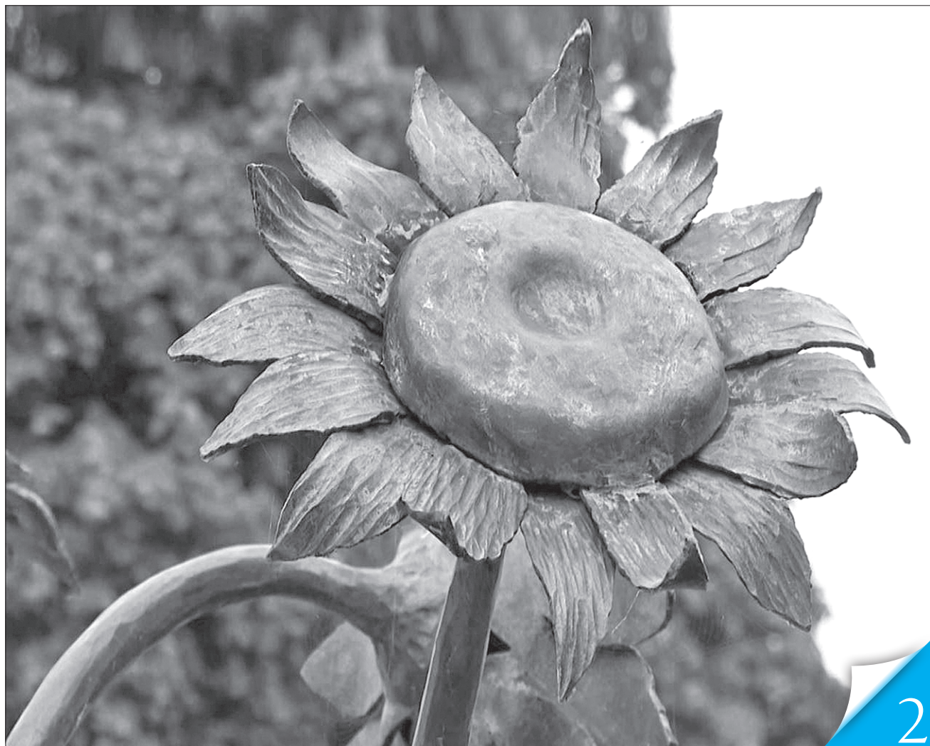
15 жителів нідерландського міста Гільверсум стали жертвами авіакатастрофи МН17. На згадку про них на одній з площ міста з'явилася клумба з мідними соняшниками як пам'ять про соняшникове поле під Донецьком, на яке впав літак

ТРАГЕДІЯ. Через п'ять років після авіакатастрофи літака Малайзійських авіаліній у небі над Донбасом Росія так і не визнала своєї безпосередньої причетності до цього злочину