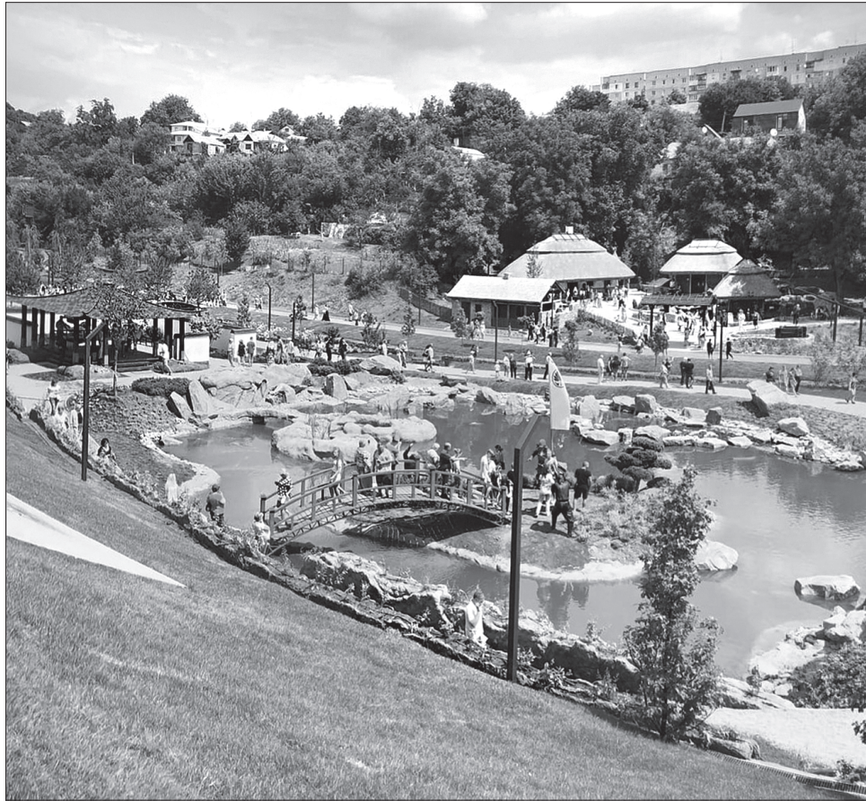
Осучаснений дендрологічний парк «Софіївка» приваблює дедалі більше відвідувачів

Як повідомила пресслужба Черкаської обласної держадміністрації, міністр культури