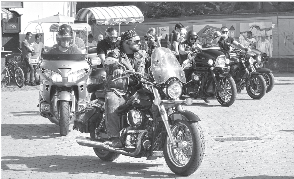
Мотоциклісти здолають 3310 кілометрів

Фініш всеукраїнського пробігу буде 23 липня в Одесі. Дехто з байкерів проїде не всю дистанцію, але головне для них — здолати частину шляху разом, чим показати єдність прагнень і бажань зберегти цілісність України.