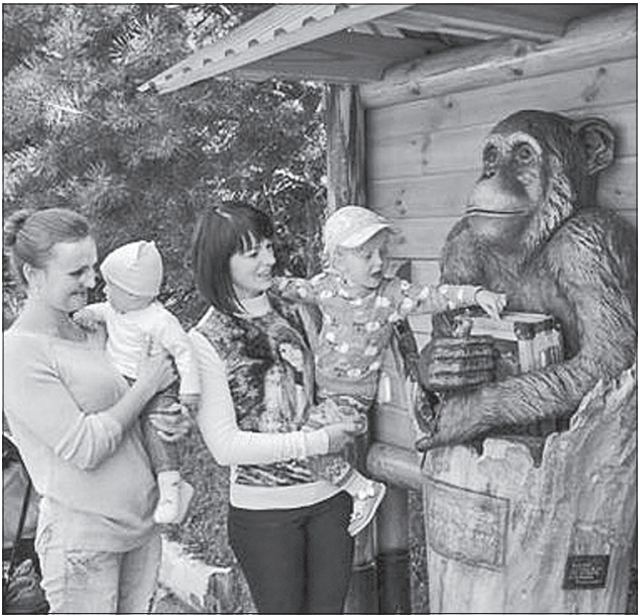
До зоопарку можна завітати навіть з маленькими дітьми, тут кожен знайде собі розвагу до душі

Кількість відвідувачів звіринця дедалі збільшується, адже задля промоції туристич-