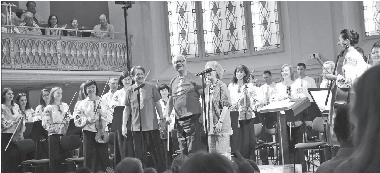
Австрійські слухачі не відпускали музикантів і вітали талановитих артистів гучними оплесками