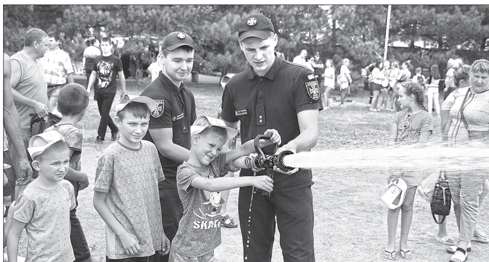
Діти вчаться приборкувати вогонь

дарунки та пам'ятні сувеніри, а головне — вони значно поповнили свої знання і навички дотримання правил безпеки, а також правильних дій у разі виникнення небезпечних ситуацій.