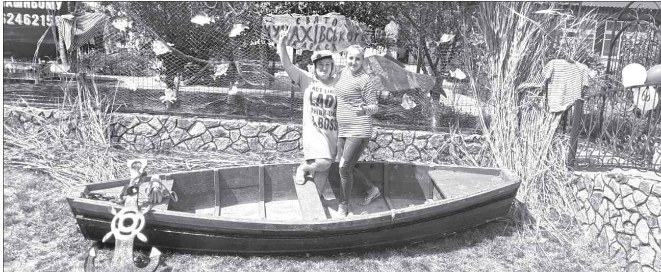
На тлі чупахівського карася в човні фотографувалися всі охочі