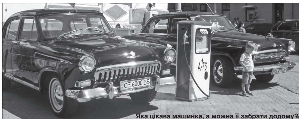
Яка цікава машинка, а можна її забрати додому?

і біле, їн і ян, ніч і день. Так, годі філософського настрою! Час продовжувати подорож.