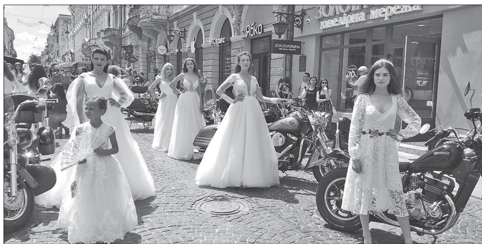
Мамо, а я байкера люблю і за нього заміню іду

щені байки, на вигляд брутальні хлопці, поруч з якими — тендітні дівчата у весільних сукнях. Здається, такий симбіоз неможливий, а подивившись на них, розумієш: прекрасна пара! Ось тоді мимоволі замислюєшся, як у світі поєднується чорне