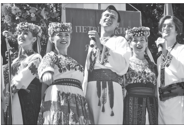
Як і колись, ярмарок відкривають музики

ли мед і медовуху, вино й сири, хліб і кондитерські вироби, сукні, сорочки й багато чого іншого. Розмаїття розваг! Але найбільше запам'яталася не мистецька світлиця «Місце зустрічі», а неймовірне байк-шоу з нареченими. До блиску начи-