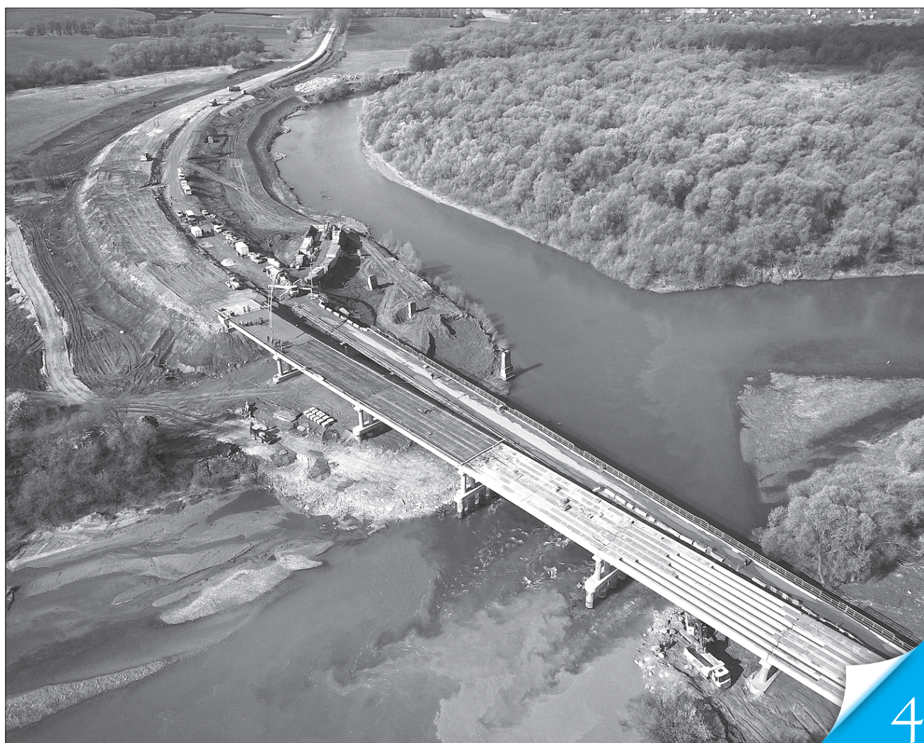
Так виглядає з висоти пташиного польоту реконструкція мостового переходу через річку Дністер у Жидачівському районі на Львівщині

АКТУАЛЬНО. «Урядовий кур'єр» цікавився, як відбувається оновлення шляхів у Житомирській, Вінницькій та Донецькій областях