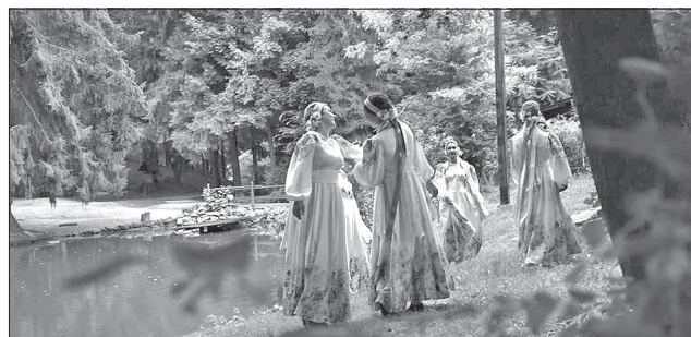
А в Музеї народної архітектури і побуту вночі долучитися до обрядових дійств

«Цього року гостей фестивалю очікує чимало цікавих