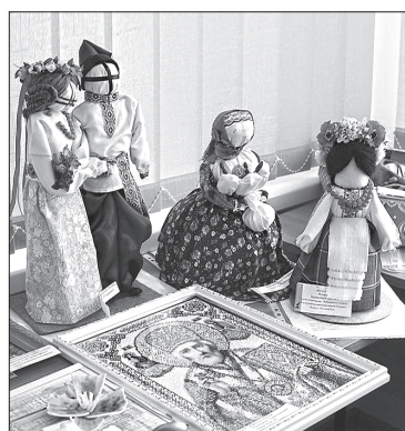
Журі важко було обрати найкращі серед творчих виробів

Також у музеї створили Алею полеглих для вшанування пам'яті про правоохоронців, які загинули за незалежність України та за безпеку співвітчизників.