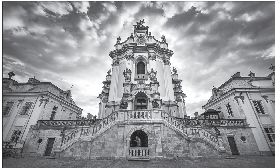
Під час фестивалю можна буде піднятися на хори Собору святого Юра

Усі охочі також матимуть нагоду виготовити масло