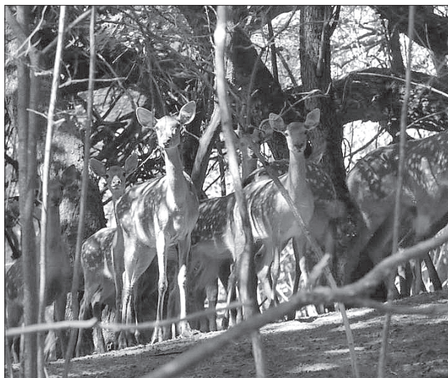
У новому вольєрному господарстві на Диканщині дадуть прихисток не лише косулям

копали ставки, вони безпечно проходять адаптацію і долають стрес. Тимчасо-