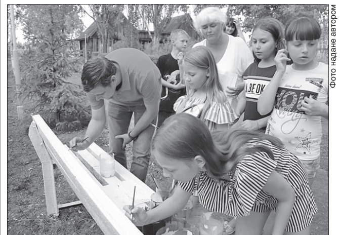
Діти з Донбасу вдячні за відпочинок

Програма з обміну дітей із різних областей працює чотири роки. За цей час на Херсонщині відпочили майже 1,5 тисячі хлопчиків і дівчаток. Лише в цьому році заплановано оздоровити близько 700 дітей з Донецької та Луганської областей. До оздоровчої кампанії долучили бюджети всіх рівнів. Дітлахи подякували за гостинність і відпочинок святковим концертом. Потім усі разом на лавках, розташованих на території табору, зробили написи «Схід і південь — разом».