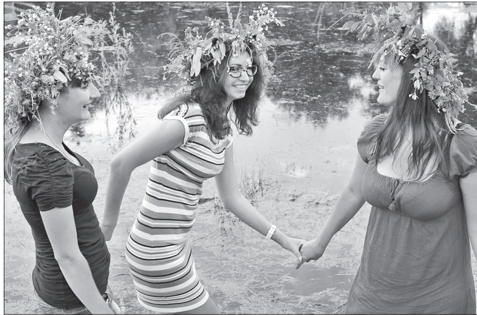
Свято Купайла єднає людей з природою. За традицією себе та оселю прикрашають травами і квітами

Купальське дерево обирають з молодих вербичок або вишень. Прикраша-