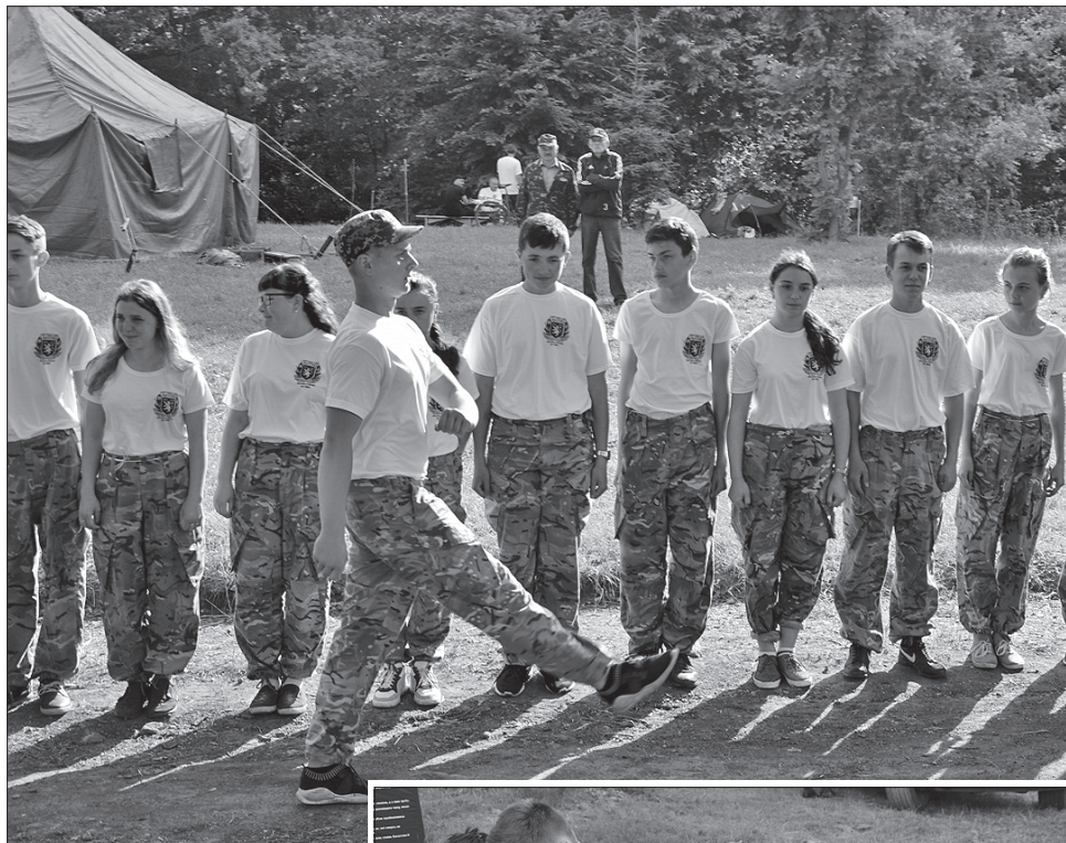
Юні змагалися у вишколі, спортивних іграх та історичних знаннях. А ввечері гуртом відпочивали та розважалися

Теренова гра — це ще й яскраві враження, нові знайомства і друзі, відпочинкові заходи. Увечері хлопці й дівчата неодмінно збиралися біля ватри, де співали, веселилися.