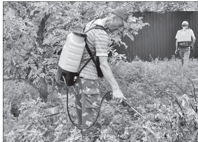
Хімічний засіб, яким обприскують амброзію, діє майже миттєво

Бригада поки що працює в режимі експерименту, бо досі в Полтаві ніхто із комунальників не обприскував амброзію. Окремі великі ділянки з рослиною обприскують за допомогою спеціально обладнаних невеликих тракторів.