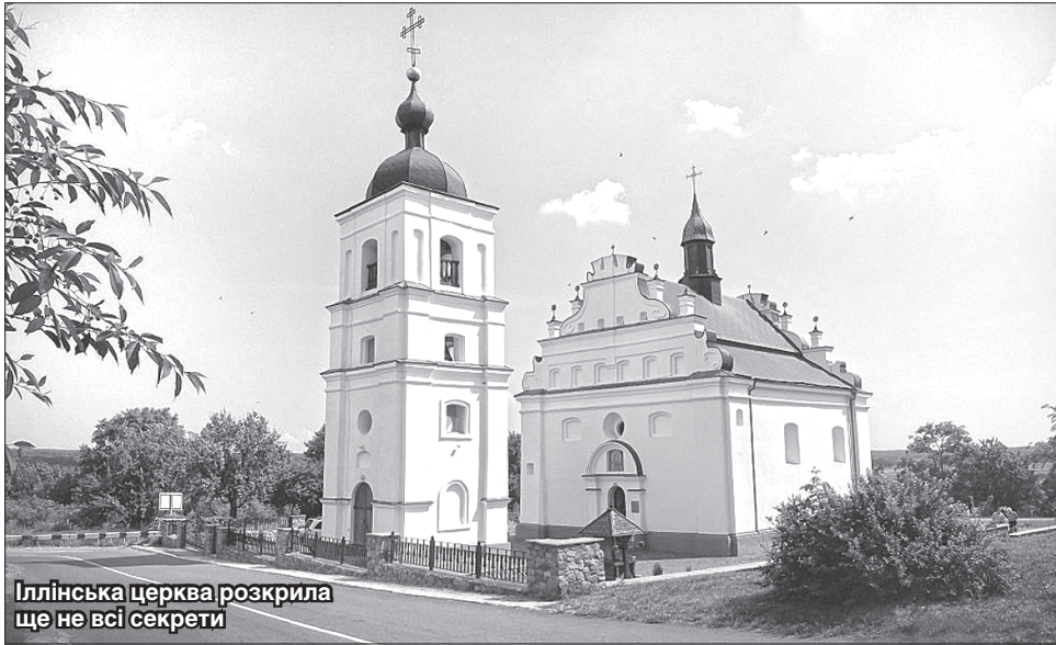
Іллінська церква розкрила ще не всі секрети