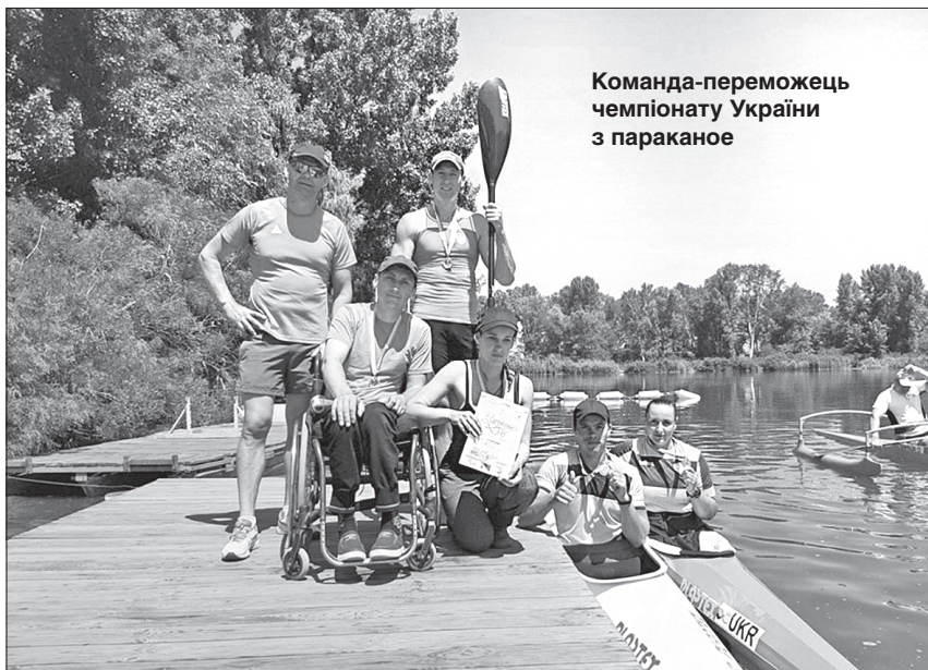
Команда-переможець чемпіонату України з параканое

Примітно, що до скарбнички перемог вихованців цього унікального закладу на аренах Європи та світу в різних видах спорту додалися нові. Так тримати!