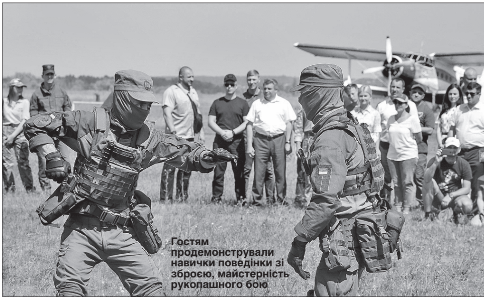
Гостям продемонстрували навички поведінки зі зброєю, майстерність рукопашного бою