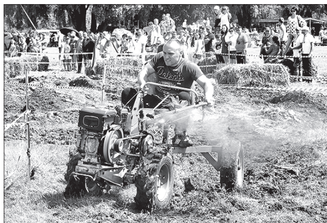
На важкій трасі мотоблок потребував великої майстерності водія

Як розповіли організатори, географія учасників змагань широка. Це, крім Черкащини, Львівщини, Дніпропетровщи-