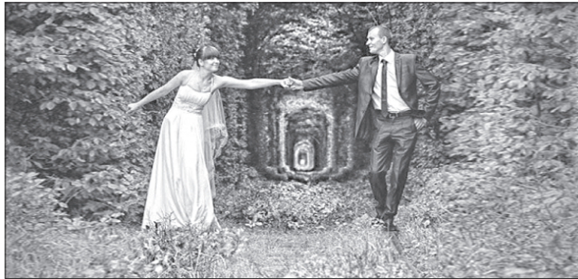
Тунель кохання — один із найпривабливіших туристських об'єктів Рівненщини

Звичайно, ви багато чули про бурштин. А чи знаєте, що він буває не тільки жовтим, коричневим і вишнево-червоним? Іноді він має зеленуватий, а ще молочний і навіть чорний колір. Видобувають таку унікальну красу тільки на півночі Рівненщини.