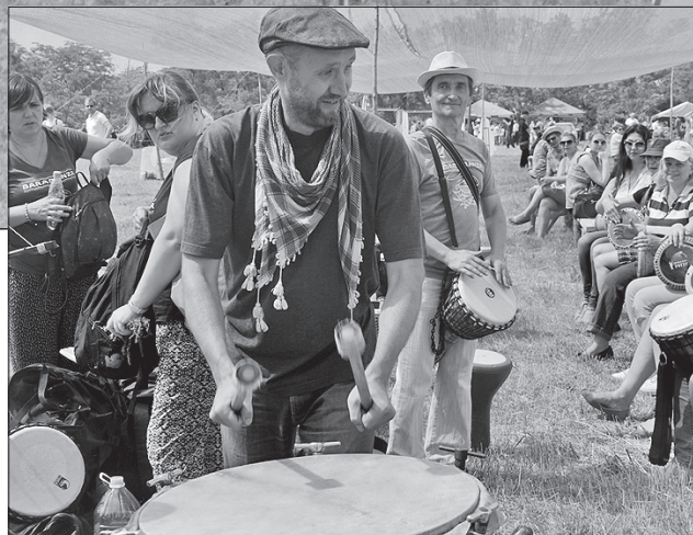
На фестивалі кожен міг знайти собі справу за власним уподобанням

«На фестивалі присутні представники майже всіх національностей, які живуть на території Донецької області. Сподіваюся, цей традиційний захід триватиме й і у майбутньому, демонструючи, що на прифронтовій Донецчині, попри цей статус, дбають про подальший розвиток, не забуваючи свої історію та традиції», — каже він.