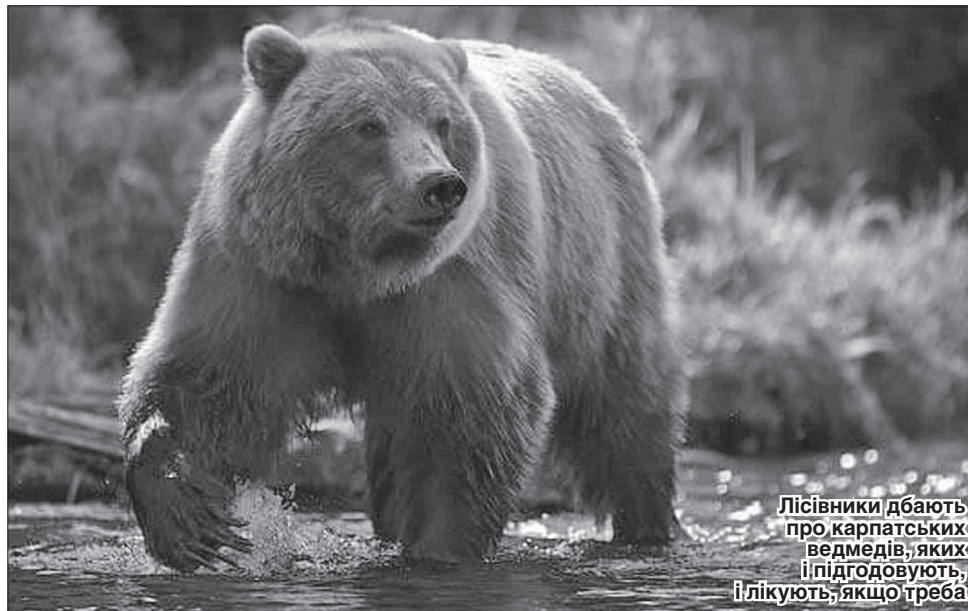
Лісівники дбають про карпатських ведмедів, яких підготовують, і лікують, якщо треба

Щоб створити максимально сприятливі умови життя цьому наймогутнішому звірові Карпат, Всесвітній фонд спільно з Німецьким інститутом провів тренінг для фахівців обласного управління лісового та мисливського господарства. Інформацію широкого спектра про бурих ведмедів отримували головні мисливознавці державних господарств «Брустурянське», «Мокрянське», «Великобичківське», на території яких мешкає найбільша кіль-