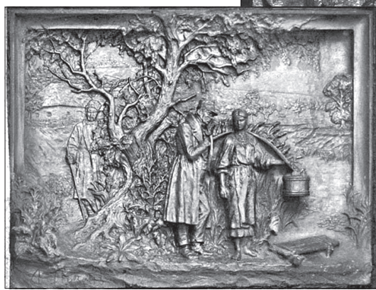
Бронзовий горельєф «Наталка Полтавка» повернувся на своє місце назавжди