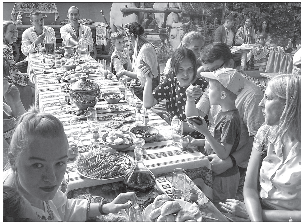
Гості мед-вино пили, галушками закусували

— Цьогорічний фестиваль «Полтавська галушка» відзначається масш-