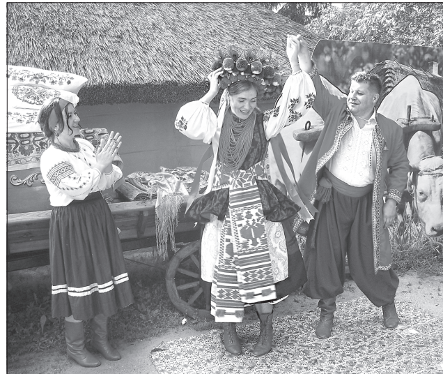
Танцюють молодий і молода

Свято гастрономічне, але з об'єднавчим підтекстом. Його мета — щоб кожна людина, побувавши тут, відчула духовну спорідненість, усвідомила, що ми єдина й велика нація.