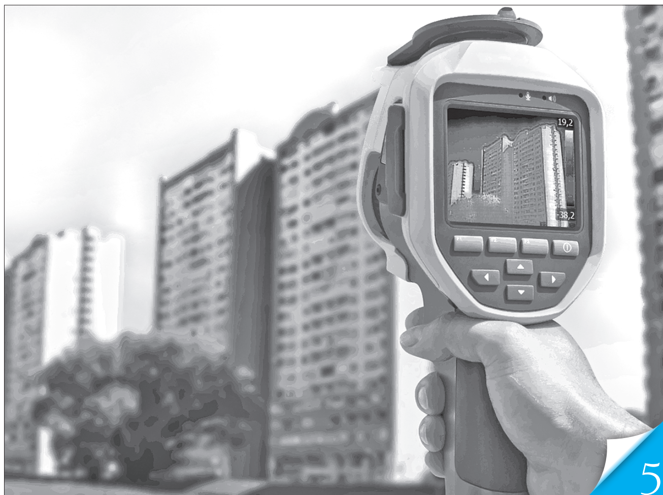
Найефективніший прилад для дослідження будинку на тепловтрати — тепловізор

102,7 млн доларів придбав НБУ за перший тиждень червня на міжбанківському валютному ринку