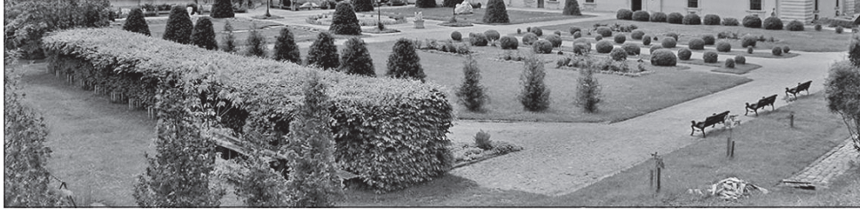
Золочівський замок зберігся фактично в первозданному вигляді

Львівська область — це не тільки Львів. Тут у невеликих містечках чи навіть селах причаїлися справжнісенькі скарби культурної та історичної спадщини. І приїжджаючи у Львів уперше, цікавишись, що неповторне можна побачити навколо міста, щоб було недорого й недалеко.