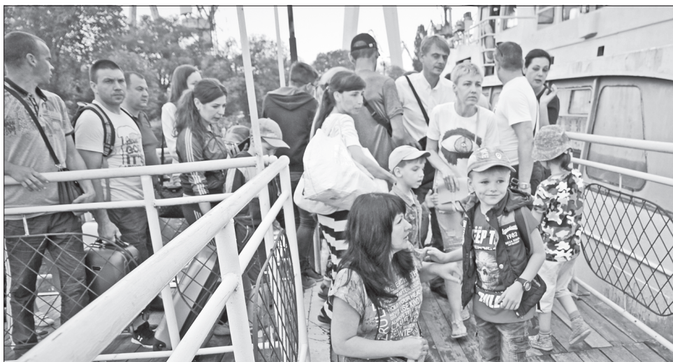
До табору діти вирушать катером

ОЗДОРОВЛЕННЯ. У Миколаєві розпочався сезон літнього відпочинку для дітей. Відкрили його діти з багатодітних і малозабезпечених родин, сироти або позбавлені батьківського піклування, діти учасників АТО (ООС), вимушено переселені особи. 125 юних миколаївців вирушили на першу зміну до табору «Дельфін». Оздоровлення триватиме 14 днів, а всі витрати взяв на себе міський бюджет. Протягом цього часу юні миколаївці матимуть насичену програму дозвілля, яка передбачає сценічні виступи, квести і конкурси, різноманітні майстер-класи, гуртки за інтересами, найактуальніші настільні ігри. У вартість путівки входить проживання в комфортабельних номерах, повноцінне п'ятиразове харчування. На території закладу з вихован-