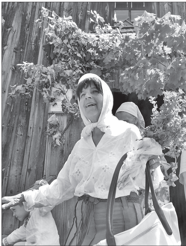
Буйство природи у червні символізує силу та міць життя

Тривають Зелені Свята тиждень. Кожному дневі