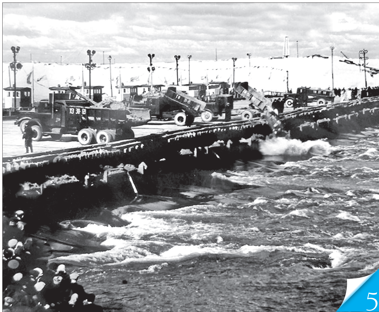
4 жовтня 1959 року о 12 годині розпочався штурм. Через дві години Дніпро було перекрито

НЕЗАМУЛЕНИЙ ПОГЛЯД. 60 років тому почали наповнювати чашу Кременчуцького водосховища