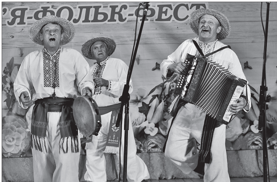
Під такі пісні ноги самі йдуть у танець, а душа сміється

Народний аматорський фольклорний колектив «Павлівшаночка» Михайлівського ОТГ Драбівського району здобув перемогу в номінації «Фольклорно-обрядове дійство». Аматори з великою майстерністю, тактом і дуже чутливо не тільки виконали обрядово-ігрові сценки, а й знайшли в своєму селі самотні старовинні жартиліви української народної пісні, які яскраво демонструють світогляд нашого народу, його життєву мудрість. Учасники колективу немов стверджували: багатющий скарб народних звичаїв ми отримали у спадок і мусимо зберегти його і, нічого не втративши, передати нашим дітям, щоб не перервався зв'язок поколінь, щоб зберегти генетичну пам'ять нашого народу. Не випадково кваліфіковане журі визнало цей колектив переможцем і в номінації «Місцевий пісен-