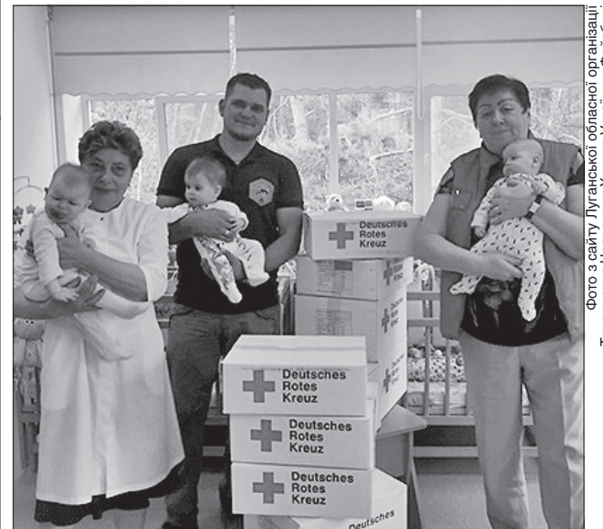
Подарунки всіх порадували