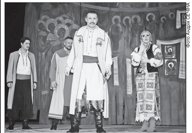
Сцена з вистави «Назар Стодоля»