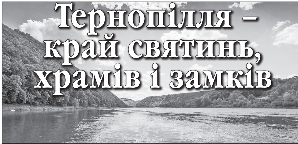
Дністровський каньйон — книга сотворення світу та мальовничості

Якщо ви відвідаєте цю благодатну землю хоч раз, вас сюди потім тягнучиме мов магнітом. І щоразу відкриватимете для себе щось нове, бо Тернопільщина унікальна історичними, архітектурними, духовними, природними надбаннями. Більш як третина всіх українських замків та їх руйн розташована саме тут, а серед найдивовижніших творинь природи — Дністровський каньйон, численні печери, Медобори, Кременецькі гори, Медобори, Кременецькі гори, Бережанське горбогір'я та понад 20 водоспадів.