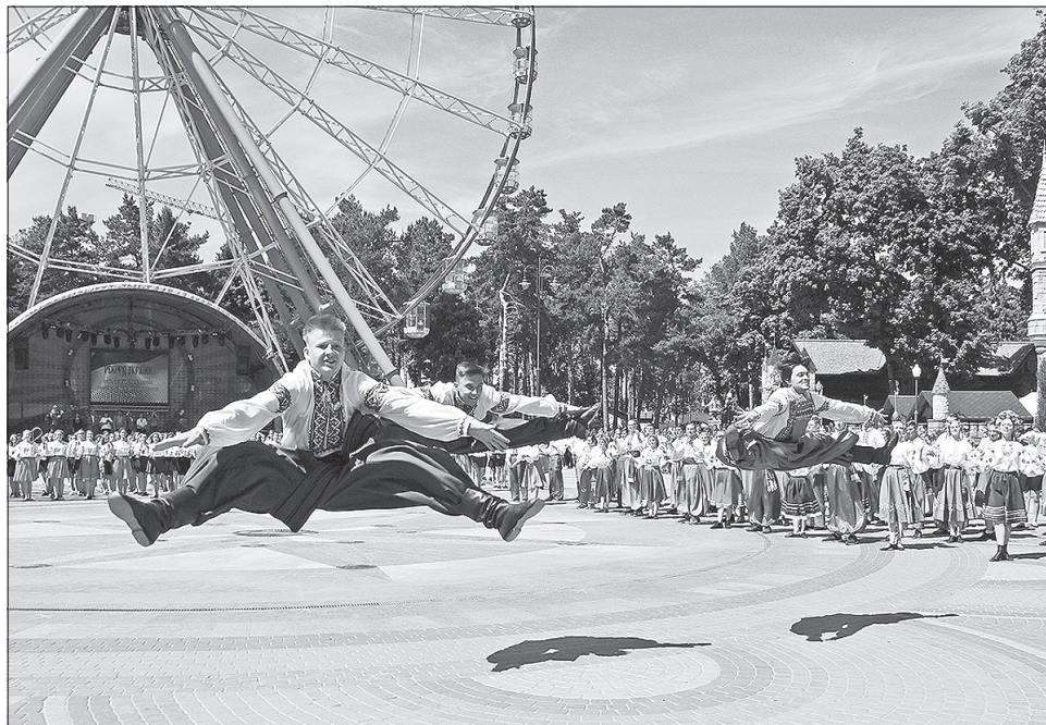
Не лише у виконавців, а й у більшості гостей ноги так і просилися до танцю