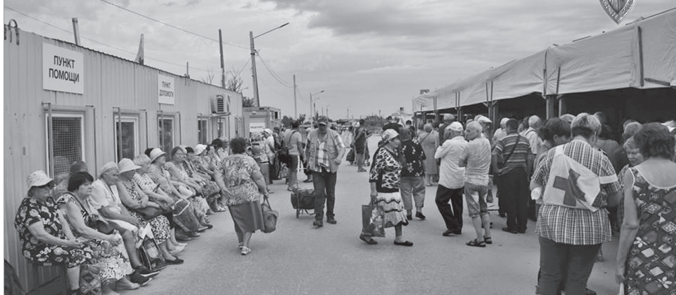
У волонтерів Червоного Хреста на КПВВ Станиця-Луганська завжди багато роботи