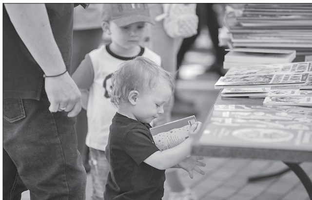
Що читати — це цікаво, розуміє навіть малечка

Було проведено благодійну акцію «Книга для бійця», пре-