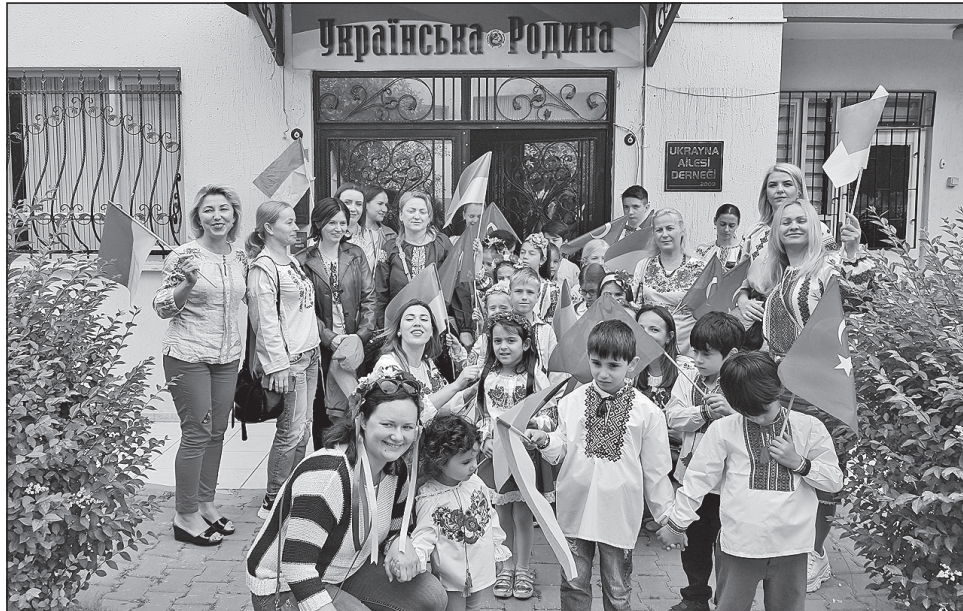
Учасники ходи до Всесвітнього дня вишиванки зібралися біля Українського центру ГО «Українська родина»