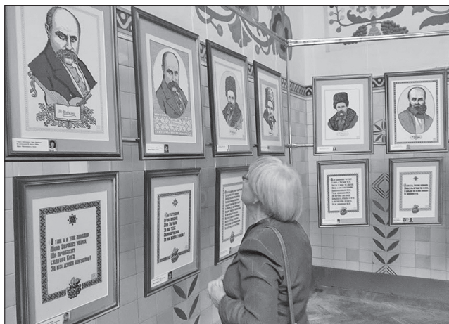
Більш як рік митці вишивали портрети й афоризми Кобзаря