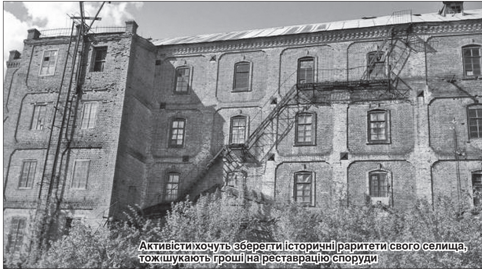
Активісти хочуть зберегти історичні раритети свого селища, тож шукають гроші на реставрацію споруди

Млин Пітера Діка збудували німці-колоністи, які у 1892 році оселились у донецькому степу на березі річки Кривий Торець і заснували тут колонію із колоритною назвою Нью-Йорк (з 1951 року селище Новгородське). До кінця 1990-х років млин працював за прямим призначенням, потім будівлю використовували як елеватор, певний час вона стояла порожньою, а недавно власник по-