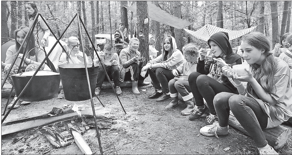
Козакам би сподобалося, як нині навчають скаутів

Упоравшись із роботою в таборах, усі виходять на локації спортивних змагань. Найбільша черга — покататися на човнах-каюках річкою. Після короткого інструктажу діти беруться за весла. А ще молоді учать в'язати морські вузли, розпалювати вогнище, основ медицини і самозахисту. Проводять й інші майстер-класи — навіть із танців. Організатори підготували понад 50 локацій, розваги, інтерактиви: тренінги змінюють по кілька разів на день.