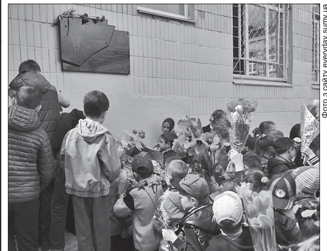
Вдячне молоде покоління пам'ятатиме подвиг Героя-земляка

Учасники мітингу поклали квіти до його могили на алеї Героїв у Сумах, де на пам'ятнику викарбувано слова Олександра: «Я хочу, щоб пам'ятали не мої справи, а мою душу...»