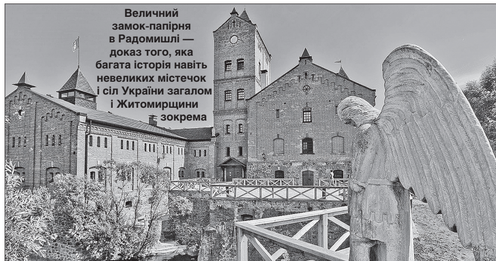
Великий замок-папірня в Радомишлі — доказ того, яка багата історія навіть невеликих містечок і сіл України загалом і Житомирщини зокрема

Та найбільша цікавинка — єдиний у світі музей української домашньої ікони, що налічує понад 5 тисяч експонатів із приватної колекції Ольги Богомолець. Це найбільше у Східній Європі зібрання іконопису. Його унікальність ще й у тому, що тут представлено так звані неканонічні ікони, які написали народні майстри на традиційних дерев'яних дошках і витесали з незвичайних матеріалів, наприклад каменю. Цих творів не цінували церковники і професійні мистецтвознавці, хоч саме так зва-