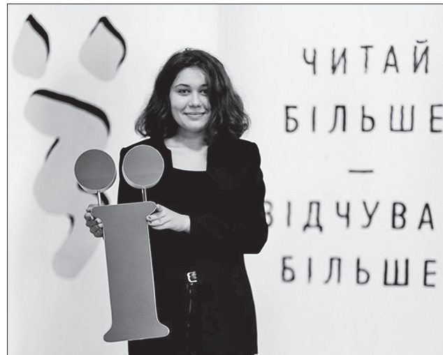
Фестиваль «І» котрий рік об'єднує молоді письменницькі таланти зі всієї України

«І» дбає про молоді таланти. Щороку найкращі з них виступають на літературній та музичній сценах. Задля цього організатори фестивалю оголошують конкурсний відбір. Нинішнього травня обрали з різних міст країни 20 молодих авторів та один музичний гурт.