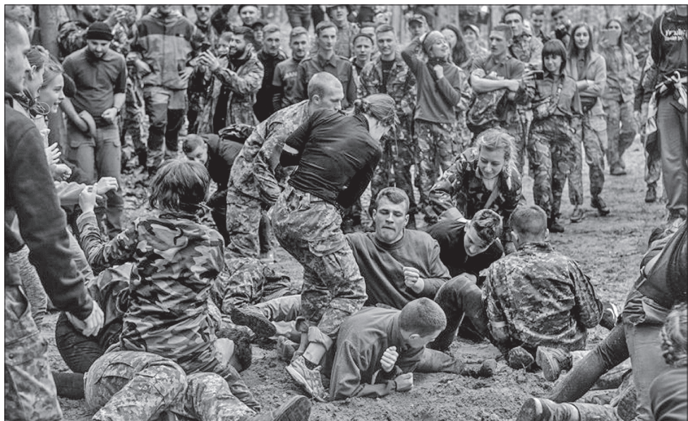
Під час гри учасники змагалися та відтворювали історичні події в лісових умовах

До речі, в незалежній Україні тут звели пантеон Слави Героїв, де після розкопок науковці упокоїли їхні останки. Біля нього проходять панахиди по загиблих. Цього року відбувся ще й фестиваль національної звитяги «Гурбифест» за участю військового оркестру ОК «Захід», творчих і аматорських колективів. Очі придбали на згадку сувеніри та книжки, почастилися гарячим кулешем. І стали учасниками церемонії нагородження переможців конкурсу «Писанкові барви Здолбунівщини», якими розквітло це святе місце.