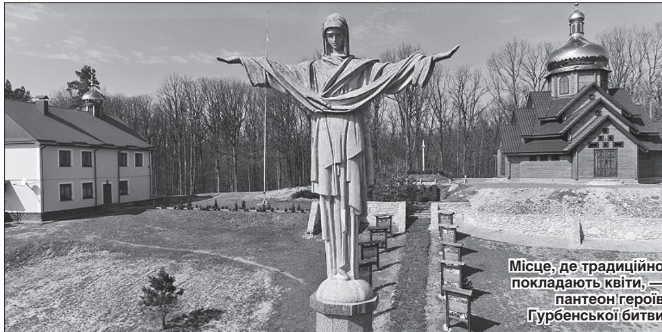
Місце, де традиційно покладають квіти, — пантеон героїв Гурбенської битви

Перемога радянських військ в цьому бою не стала вирішальною, адже головної мети наступу бригад НКВС на Гурби не було досягнуто — загонів УПА не знищено. Тож вони й надалі проводили воєнні та пропагандистські акції. Боротьба за свободу тривала ще понад десять років. Опісля совіти спалили навколишні села Гурби та Антонівці, а жителів вивез-