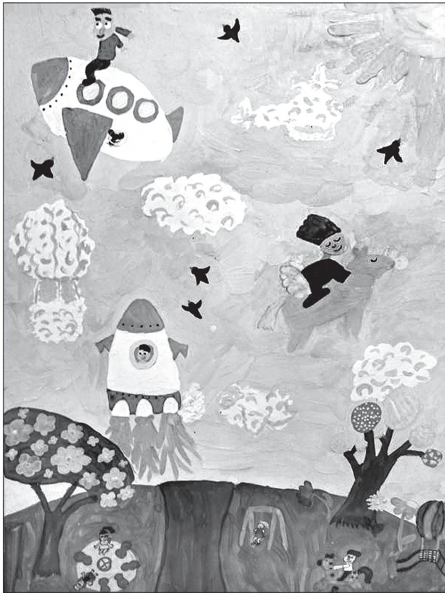
Малюнок з сайту zik.ua