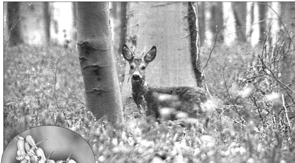
Від середини квітня й до початку травня ліс поблизу Брюсселя прикрашає блакитний килим диких гіацинтів

Загальна площа лісу — близько 555 гектарів. Для охочих помилуватися гіацинтами лісництво відвело два маршрути завдовжки сім кілометрів. Ці широкі стежки обнесено мотузкою загорожено. Адже дікі гіацинти заборонено не лише рвати, по них не можна ходити, бо квітковий килим дуже ніжний, і його легко можна пошкодити.