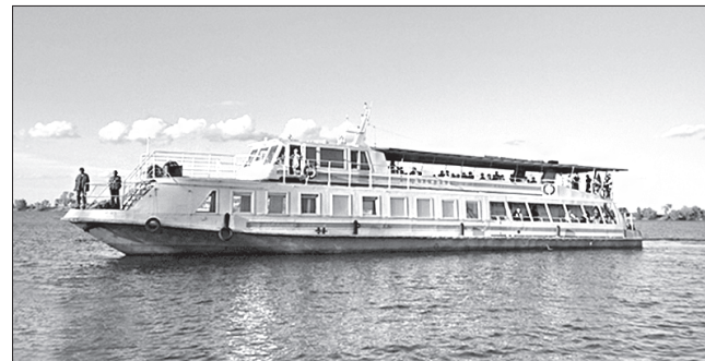
Теплохід «Герой Дубинда» вирушає в плавання

Для багатьох жителів Черкас такі прогулянки Дніпром стали традиційними. Нинішнього сезону організатори відпочинку намагатимуться його