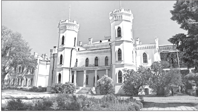
Під час відвідин Шарівського палацово-паркового комплексу «Садіба» ви зрозумієте, чому його називають «Білим лебедем»

До послуг туристів два готелі в районі Богодухів,