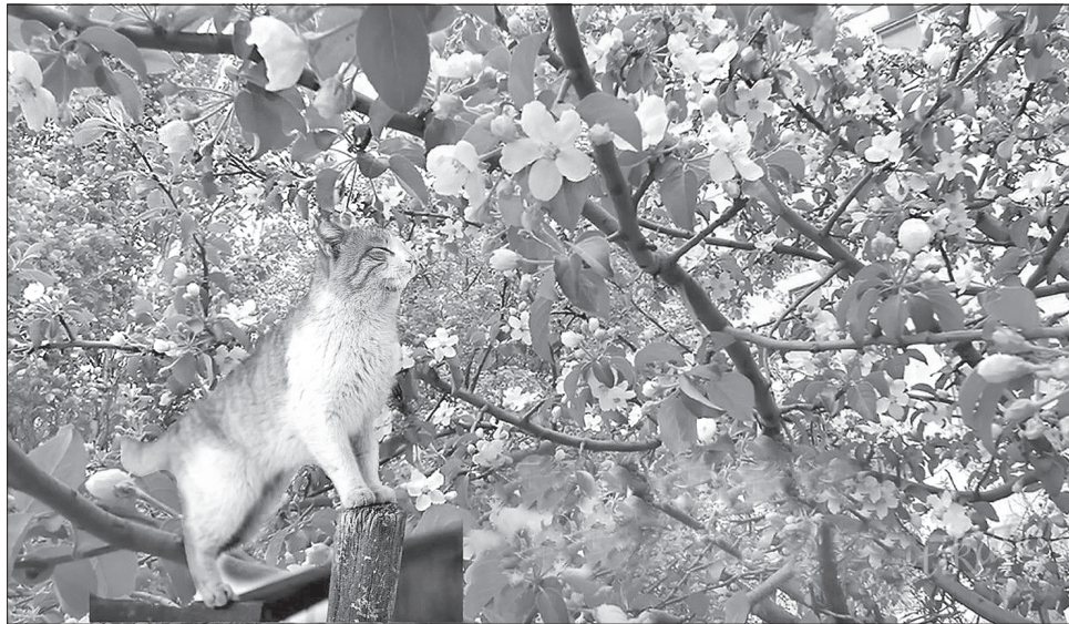
Весна буяє цвітом і радує теплом

Вранішня Юрєва роса має цілющі властивості. Корисно нею вмитися, а потім походити по росній траві босоніж. Від Юрія починали орати поле під ярвину. Нічні