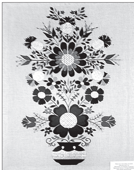
«Пасхальний триптих» Ангеліни Нянчур