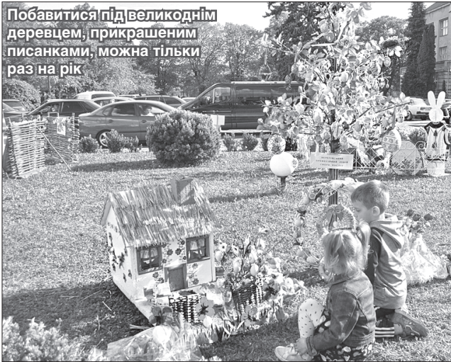
Побавитися під великоднім деревцем, прикрашеним писанками, можна тільки раз на рік