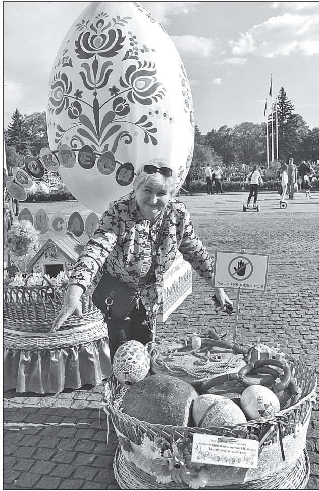
Гостей зустрічає головна героїня — двометрова писанка